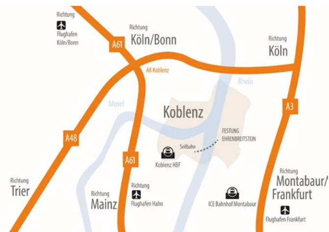
ZO VINDT U ONS

Proviand voor uw veroveringstour vindt u bij de kiosk of in de biertuin met het mooiste uitzicht van Koblenz. Restaurant Casino van Café Hahn in het fort biedt een sprookjesachtig uitzicht en moderne Pruisische gerechten.