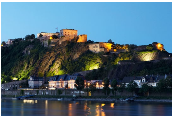
DE VESTING EHRENBREITSTEIN